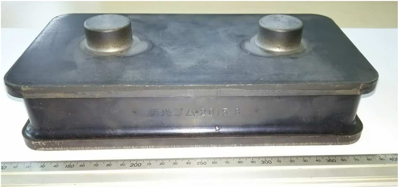
三岐鉄道様向け鉄道用防振ゴム

三重県の桑名市、いなべ市、菰野町を結ぶ三岐鉄道様向けに防振ゴムを開発から製造まで受注させていただきました。