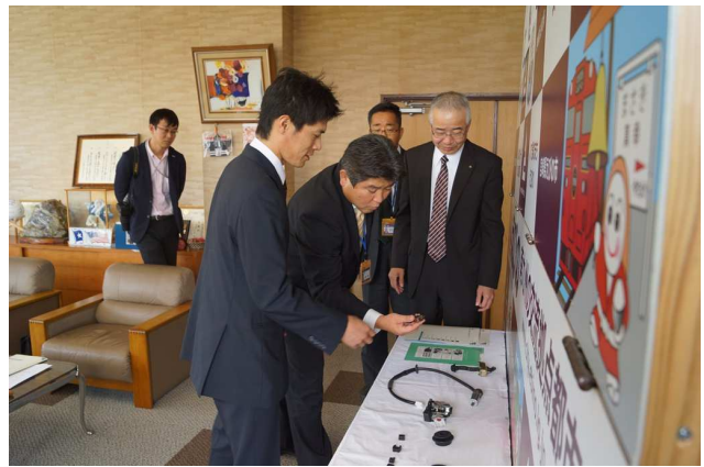
当社の製品を確認される市長